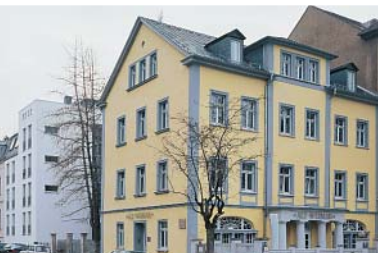
Hotel und Restaurant ALT WEIMAR